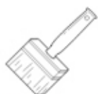
Кисть для клея