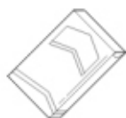
Клей для флизелиновых обоев